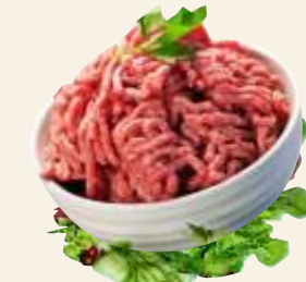
■ Mielone wp.-woł.