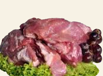
■ Wieprzowina gulaszowa