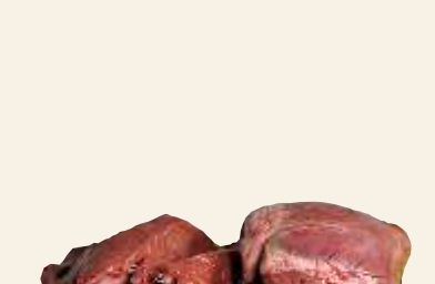
■ Serca wp.