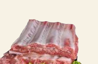
■ Zeberka wp. paski