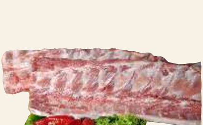
■ Kości mięsne