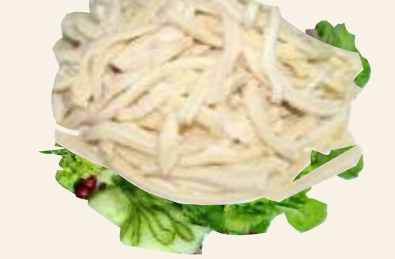
■ Flaki wołowe