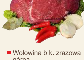
■ Wołowina b.k. zrazowa góra