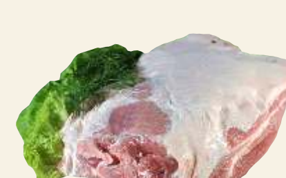
■ Łopatka wp. z k.