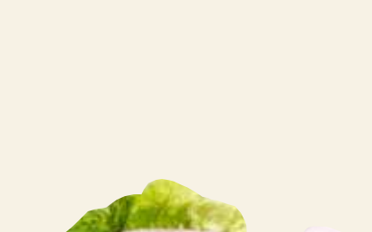
■ Podudzie z indyka