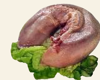
■ Ozor woł.