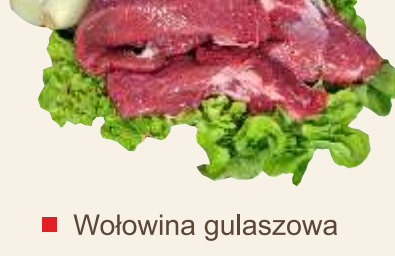
■ Wołowina gulaszowa