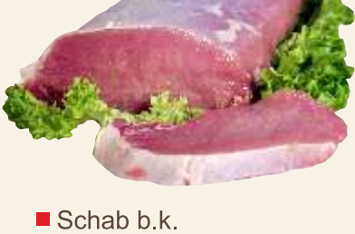
■ Schab b.k.