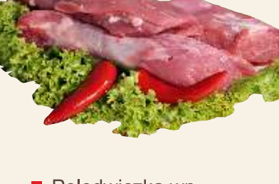
■ Połędwiczka wp.