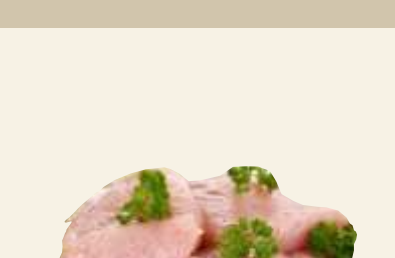
■ Filet z indyka