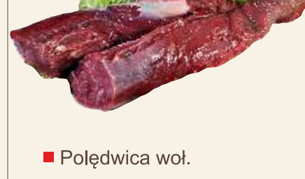
■ Połędwica woł.