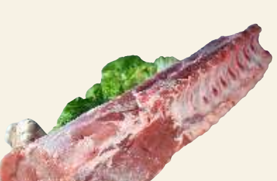
■ Schab z k.