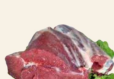
■ Prega woł. b.k.