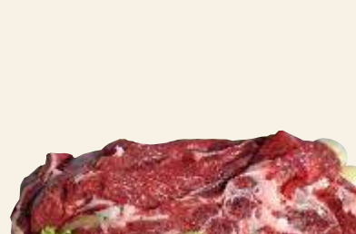
■ Wołowina rosolowa