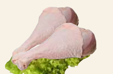
■ Podudzie z kurczaka