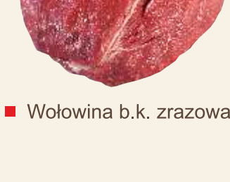
■ Wołowina b.k. zrazowa