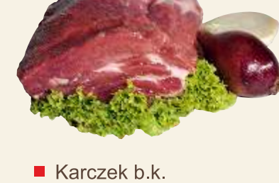
■ Karczek b.k.