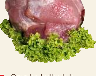
■ Szynka kulka b.k.