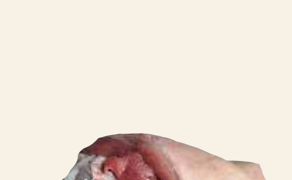
■ Golonka tylnia