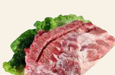
■ Karczek z k.