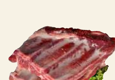
■ Zeberka wp. trójkąty