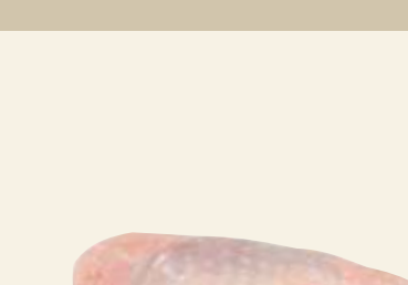
■ Udziec z indyka