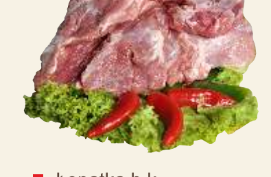
■ Łopatka b.k.