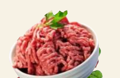
■ Mielone wp.-woł.