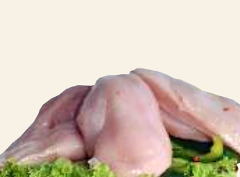
■ Filet z kurczaka