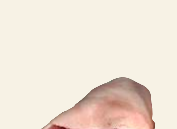
■ Golonka przednia