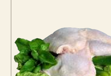
■ Ćwiartka z kurczaka