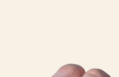
■ Nogi wp.