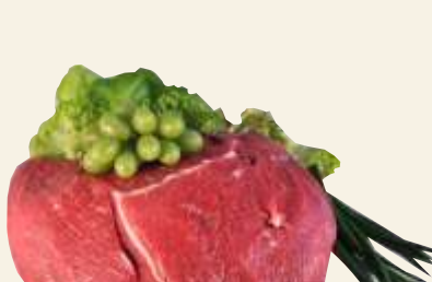
■ Wołowina b.k.