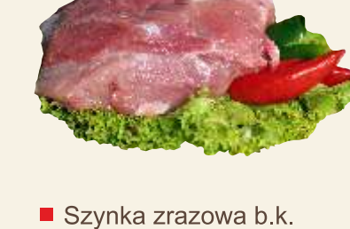
■ Szynka zrazowa b.k.