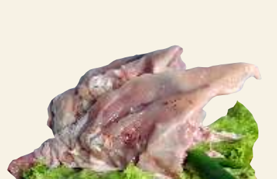
■ Porcje rosolowe