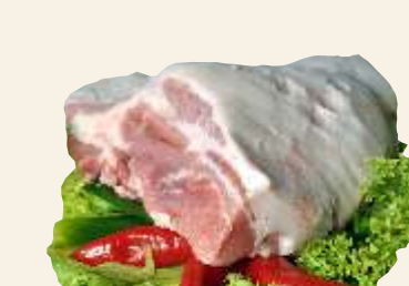
■ Podgardle białe