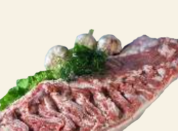
■ Boczek biały